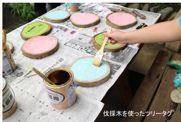
伐採木を使ったツリータグ

今回の町田生きもの共生フォーラムでは、活動事例報告に加えて、フィールドを実際に歩き、広場での交流を予定しています。